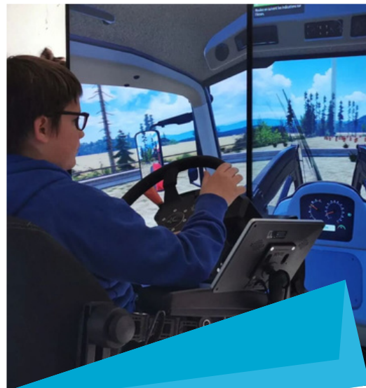
Simulateurs de conduite d'engins agricoles