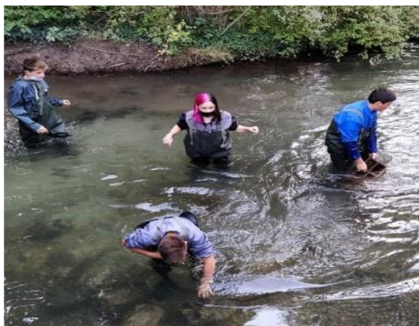
Création d'une frayère

Diplôme et attestations: Diplôme national du brevet série professionnelle, attestation scolaire de sécurité routière ASSR2, formation aux gestes qui sauvent, PIX (brevet informatique)