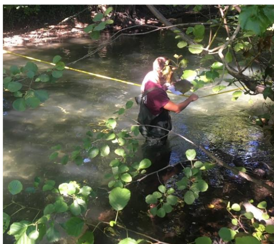
Création d'une frayère