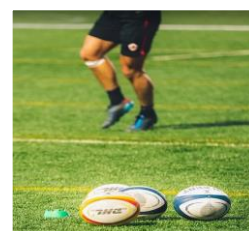
Section sportive rugby