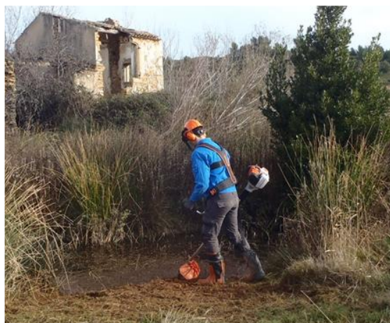
Débroussaillage en Camargue